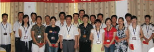
▲ FQCT第二季度优秀工作者