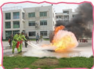
FQCT 冯伟民 FICT 宋轶群

为积极配合集团宣传月活动，2007年6月，两港安监保卫科牵头，组织全体员工进行消防预案演练。演练内容包括油盘灭火、泵浦操灭火、办公楼人员疏散等三项。在演练中大家提高防火安全意识，并增强自我保护意识，掌握了消灭初级火灾及火险中逃生的基本技能。