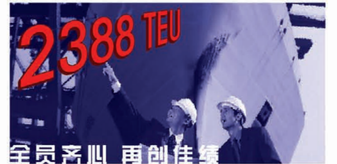
——FICT单船作业量创新高

2007年8月11日，FICT在对地中海航运公司(MSC)欧洲线的“MSC LUISA”轮作业中，创下了单船作业量1512自然箱(合2388TEU)的记录，刷新了于2007年7月2日在对地中海航运公司(MSC)欧洲线的“MSC MAUREEN”轮作业中创下的1306自然箱(合1949TEU)单船作业量记录。